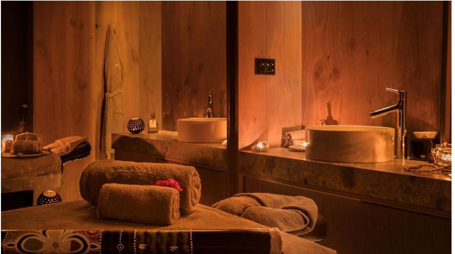
Una estancia del Mayan Secret Spa del Claris Hotel & Spa 5* GL

Concretamente, el grupo especializado en tratamientos de la cultura prehispánica maya tiene dos spas. Por un lado, Mayan Secret Spa del Claris Hotel & Spa 5* GL y, por el otro, Mayan Luxury Spa de El Palace Barcelona 5* GL , ambos multipremiados. También cuenta con las Mayan Spa Suites , que ofrece tratamientos a suites de tres hoteles de lujo de la Ciudad Condal .